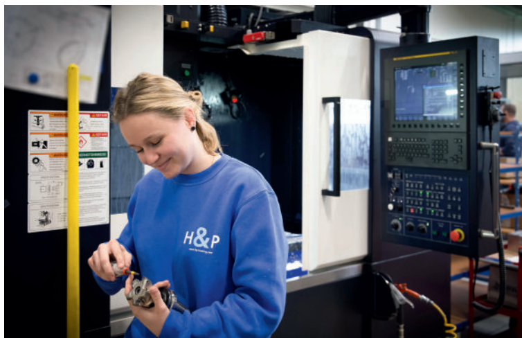
Weithin bekannte „Troubleshooter“: Die H&P Railservice GmbH gilt als Spezialist für alles, was es noch nicht oder nicht mehr gibt am Markt.